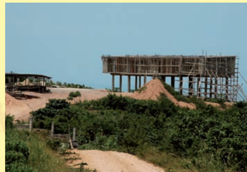
Area di intervento del BUC

L'autonomia futura dell'università e la sua sostenibilità nel lungo periodo sono assicurate dalla gestione locale. Sin dall'inizio Amicus ha scelto di avvalersi, laddove possibile, di personale locale qualificato, in grado di