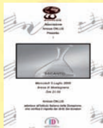
Locandina della serata