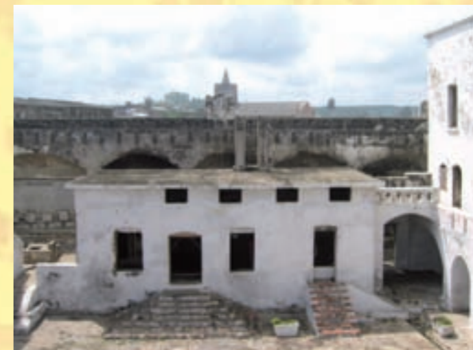
Una veduta di Fort William

Il Baobab University College rappresenta il progetto forse più ambizioso di Amicus: la creazione di un polo universitario innovativo. L'obiettivo dell'associazione, che nei suoi 5 anni di attività ha sviluppato progetti di crescita per la popolazione ghanese, è quello di creare una struttura che sia capace di valorizzare le capacità dei giovani locali. Si tratta di dare la possibilità ai ghanesi di avere una formazione adeguata, un'istruzione universitaria anche a coloro che non hanno mezzi finanziari per permettersi gli studi ma che dimostrino merito e capacità. Il progetto nasce con la convinzione che sono i giovani la forza che potrà portare avanti lo sviluppo del paese , e che la formazione è l'arma migliore contro la disoccupazione e il sottosviluppo. Una volta realizzate le strutture idonee ad ospitare aule e residenze per studenti e insegnanti, il BUC sarà pronto ad offrire corsi universitari relativi a tre facoltà: Scienze Infermieristiche, Business Administration e Information Technology. Sono queste le aree nelle quali scarseggiano le figure professionali e di cui c'è più bisogno.